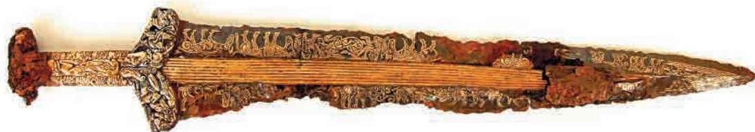
Меч до и после реставрации.