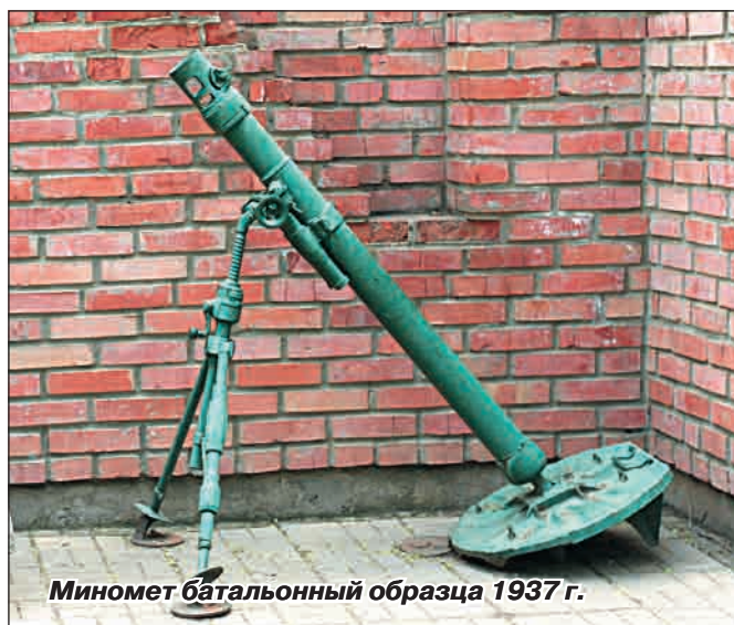
Миномет батальонный образца 1937 г.

ственной поддержки пехоты до одного из основных видов артиллерии. Сведенные в части и соединения, к концу войны они стали могучим огненным средством артиллерийских дивизий прорыва. Достаточно сказать, что уже в 1943 году более половины всех наших артиллерийских средств приходилось на долю минометов.