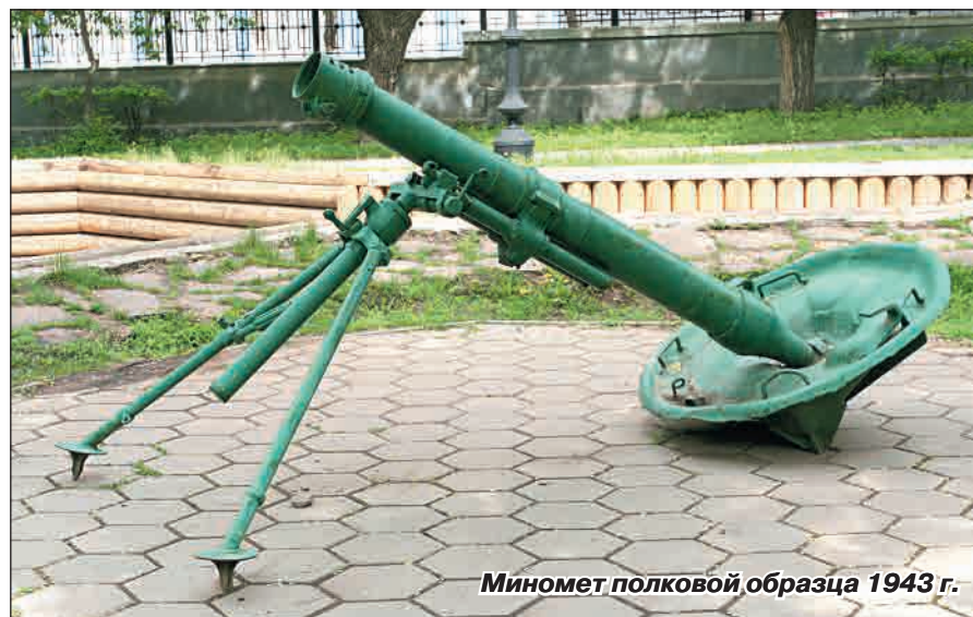
Миномет полковой образца 1943 г.